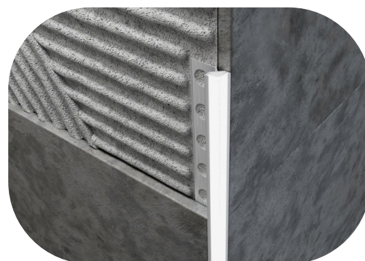
Esempio di installazione