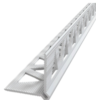
Paraspigolo a testa tonda