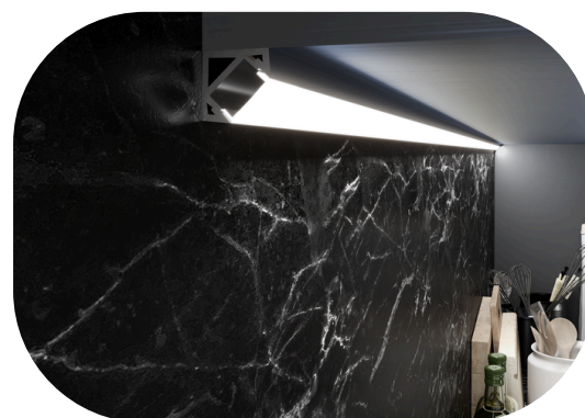
Esempio di installazione